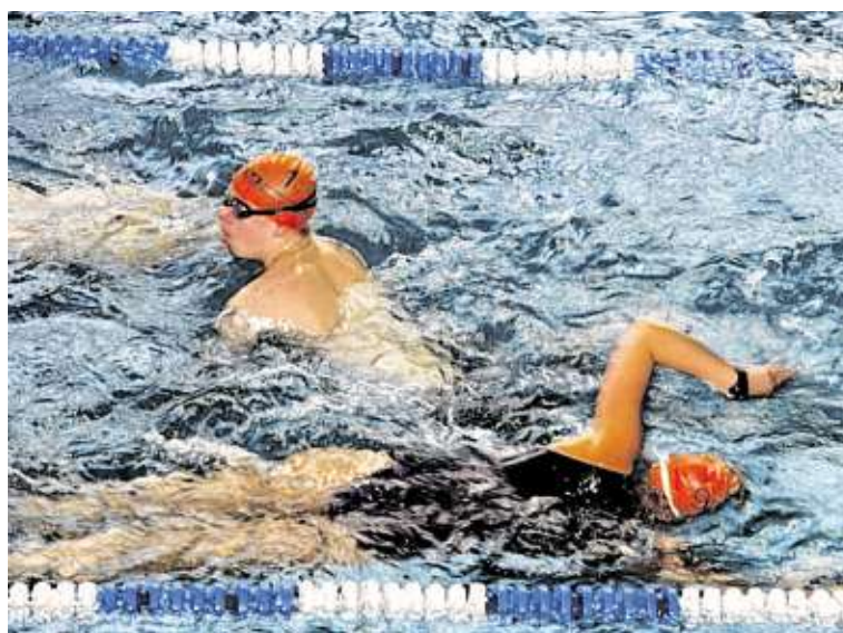
Hoher Seegang: Vom sechsten 24-Stunden-Schwimmen in Mellrichstadt zeigten sich viele Teilnehmer begeistert.